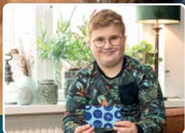
LUKE PRIJSWINNAAR WOORDZOEKER